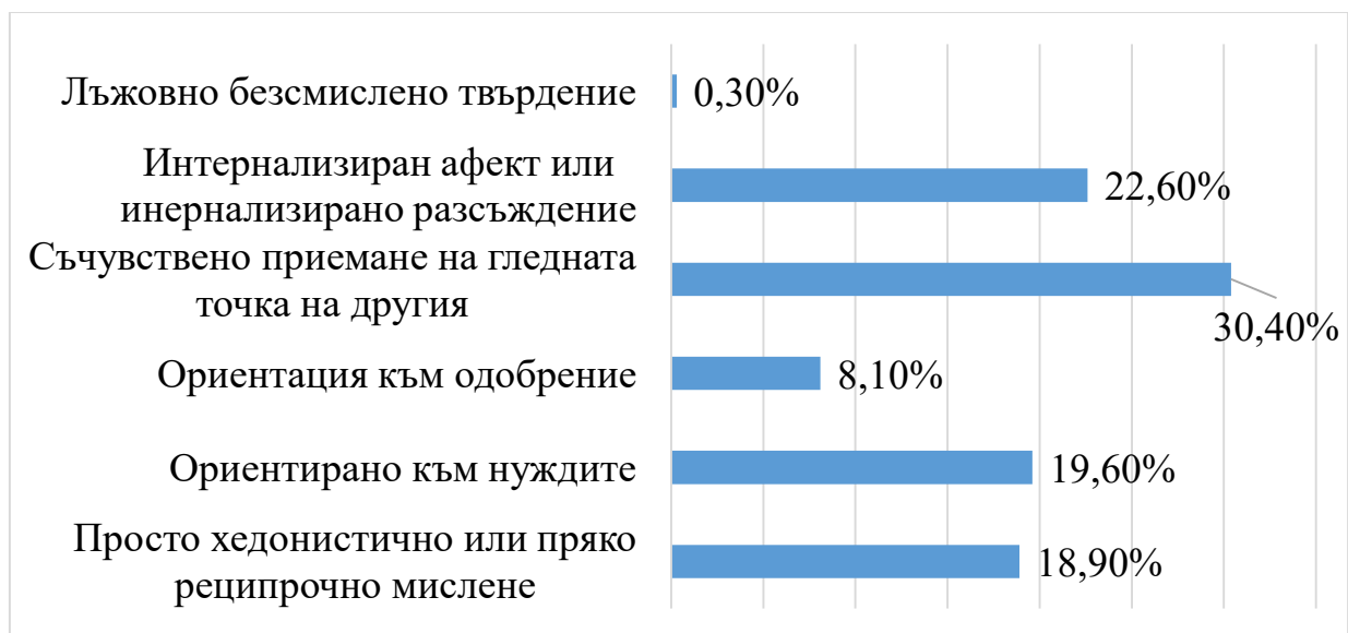
Фиг. 1 Графично представяне на изследваните лица според равнищата на просоциалното мислене